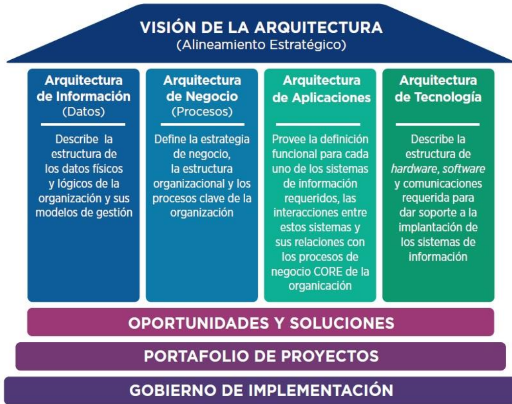
Figura 2. Construcción de la Arquitectura Digital

Fuente: Adaptación de Colombia Digital del gráfico de Amazing Consultores.