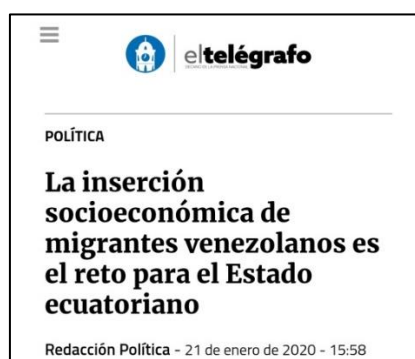
Figura 4. (21/01/2020). La inserción socioeconómica de migrantes venezolanos es el reto para el Estado ecuatoriano. El Telégrafo.