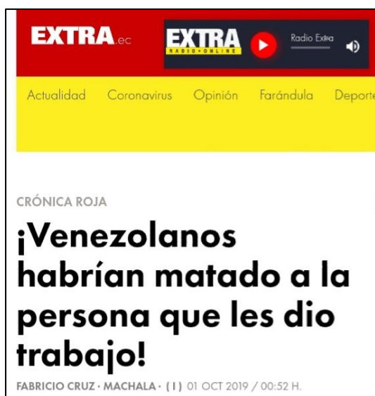
Figura 9. (01/10/2019). ¡Venezolanos habrían matado a la persona que les dio trabajo!