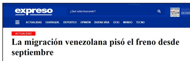
Figura 3. (26/12/2019). La migración venezolana pisó el freno desde septiembre. Expreso.