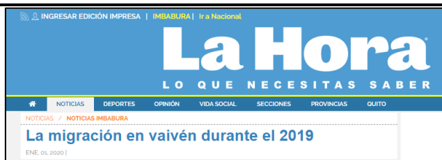
Figura 1 (01/01/2020). La migración en vaivén durante el 2019. La Hora.

Existe un predominio de titulares emotivos, sentimentalistas e incitadores de odio en lo que a temas migratorios se trata, y en el desarrollo de las noticias analizadas constantemente se coloca la cantidad de venezolanos desplazados, fuertes testimonios de vida de migrantes venezolanos que intentan generar empatía pero que en realidad terminan generando un sentido de lástima hacia el venezolano en el imaginario social del ecuatoriano. Además que se observa un predominio de la mención de la nacionalidad en los titulares de 39 de las 54 noticias analizadas (de las cuales 38 menciona “venezolanos”, 1 menciona “colombiano” y el resto, al referirse en su mayoría a personas de otros países latinos, europeos o asiáticos se refiere a ellos simplemente como “extranjeros” o “migrantes”), lo cual no debe hacerse según lo estipulado en la Guía Práctica para Comunicar sobre Movilidad Humana del Programa de las Naciones Unidas para el Desarrollo (PNUD).