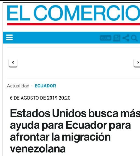
Figura 2. (06/08/2019). Estados Unidos busca ayuda para Ecuador para afrontar la migración venezolana. El Comercio.