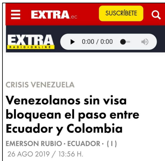
Figura 8. (26/08/2019). Venezolanos sin visa bloquean paso entre Ecuador y Colombia.